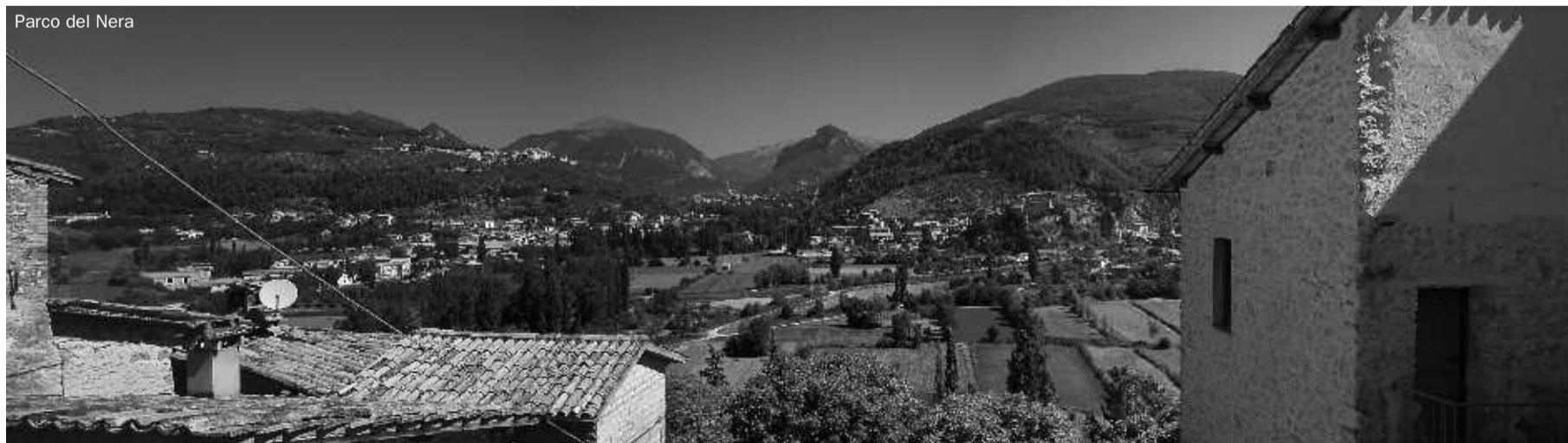
Parco del Nera

In questo quadro l'esito possibile, e tutt'altro che improbabile, è che rimanga tutto immutato. Intanto c'è una richiesta di proroga da parte di molte province e vi sono ricorsi alla Consulta che aspettano di essere discussi. Soprattutto vi sono i tempi ormai stretti di chiusura della legislatura e di cambio di governo. E' probabile che il decreto venga convertito in legge, ma poi ci sono i tempi lunghi degli applicativi, mentre le attuali amministrazioni provinciali resteranno in carica fino a metà 2014. In un anno e mezzo si possono mettere in moto tutte le manovre dilatorie che si vogliono. Così, quella che poteva essere l'occasione per discutere e riformare gli assetti endoregionali nel loro complesso, verrà perduta, mentre la crisi dello Stato e delle sue articolazioni continuerà, cumulando inefficienza e sprechi, forme di centralismo e negazione di percorsi democratici. Insomma: tanto rumore per nulla.